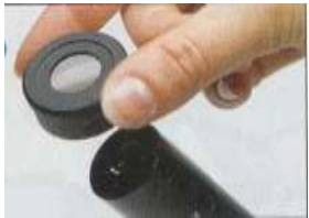
l'analyseur sur l'oculaire

Le microscope polarisant est doté de deux polaroïds, l'analyseur et le polariseur