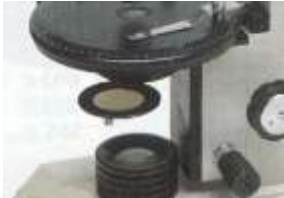
le polariseur sous la platine