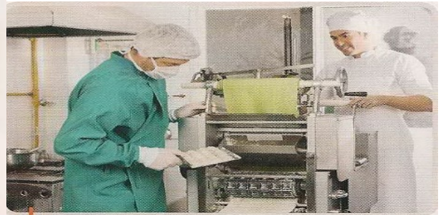
3. Porter des vêtements adaptés.