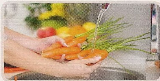
2. Laver les légumes.