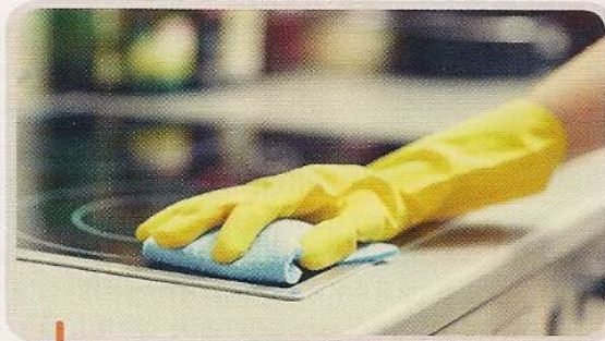
1. Nettoyer les plans de travail.

Les règles d'hygiène permettent d'éviter que nos aliments ne soient contaminés par des microbes. En voici 4 :