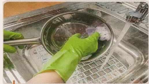
4. Nettoyer les instruments de cuisine.

Sur l'image ci-dessous, une inspectrice sanitaire vient vérifier que le cuisinier tient bien sa cuisine. Elle est horrifiée par ce qu'elle voit. Entoure en rouge 4 éléments qui ne vont pas.